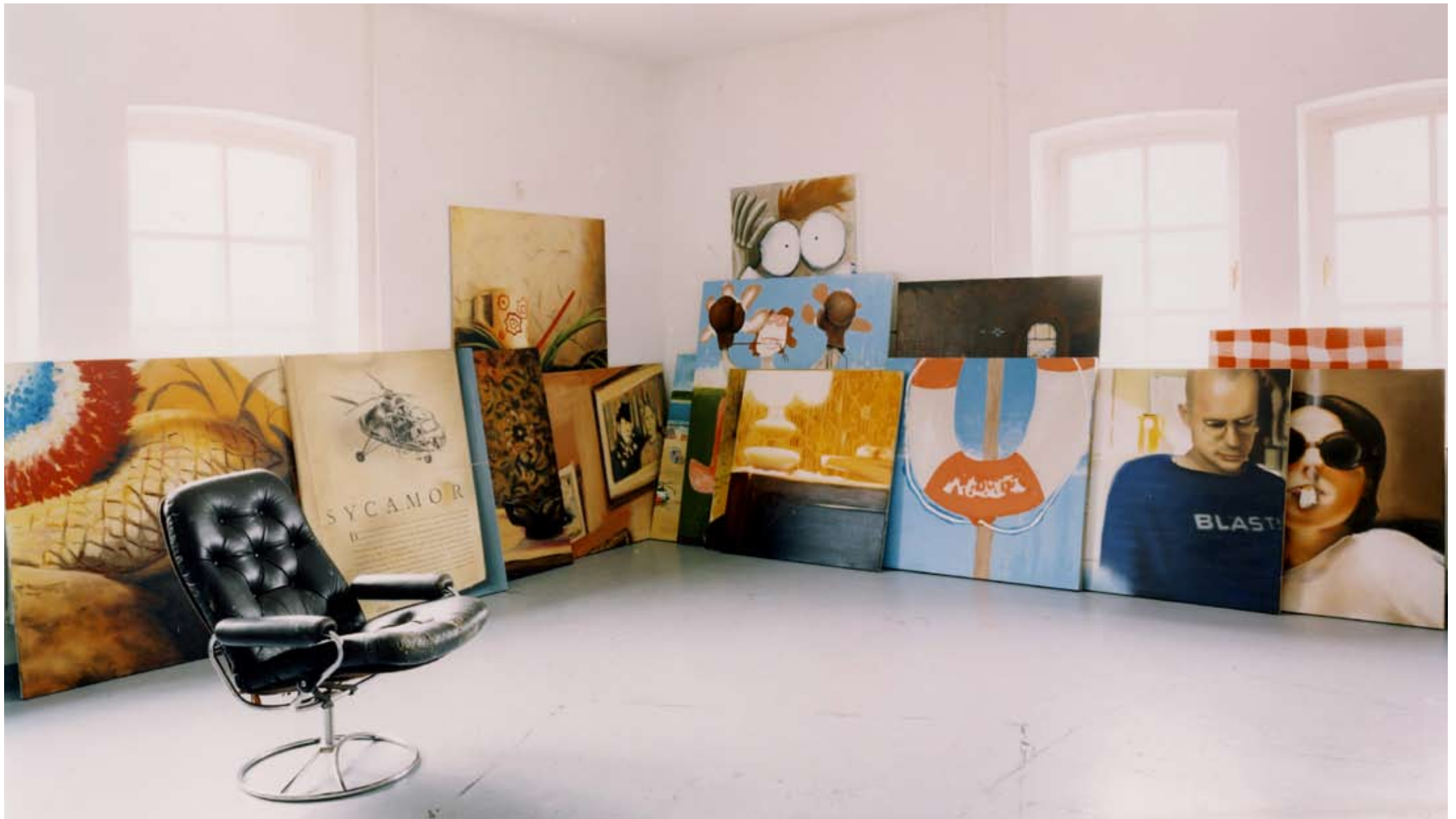
EVA WEYMANN MALEREI