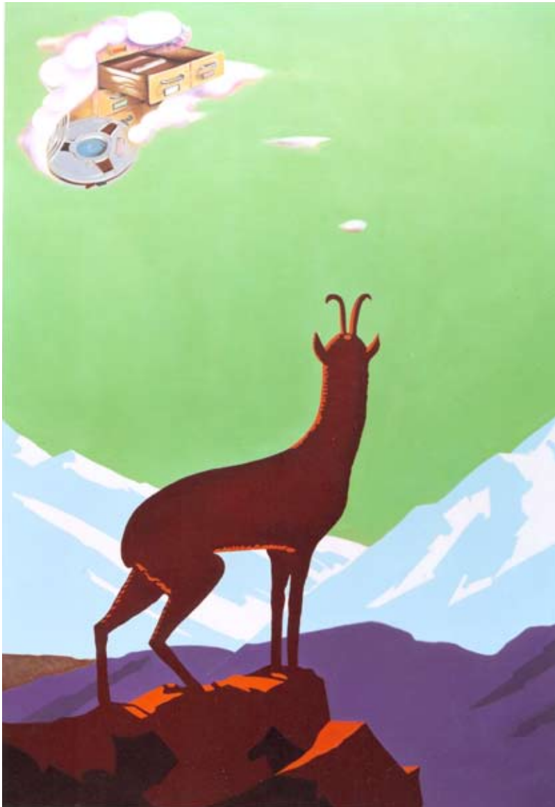
ARGELÈS GAZOST 250×170 cm ÖL AUF LEINWAND 2004