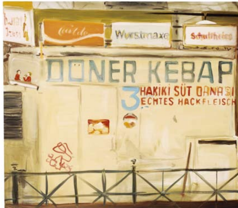
HUBSCHRAUBER 3 / DÖNER KEBAP ACRYL AUF LEINWAND 160 x 138 CM 2003