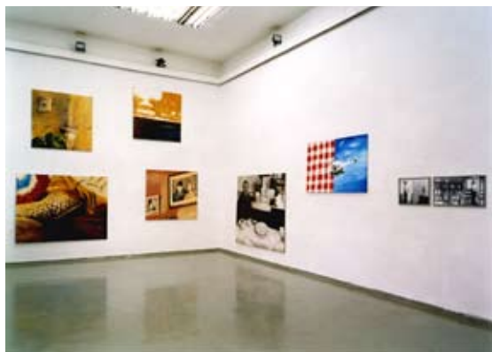
THE HELICOPTER SHOW SBC BEOGRAD 2009

EVA WEYMANN NATHANAELSTR. 3 04177 LEIPZIG TEL. +49(0)341 2000950 e.weymann@gmx.de